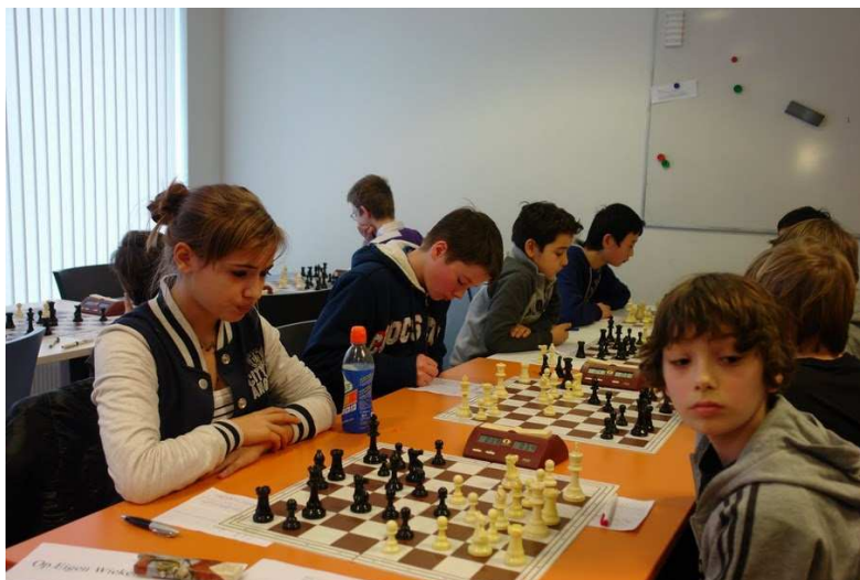
Op Eigen Wieden Meesterklasse D