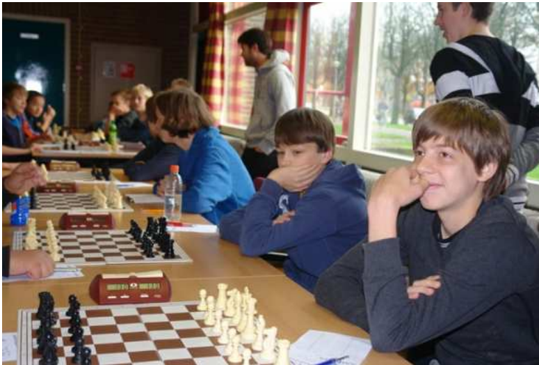
Nuvema D4 Meesterklasse C