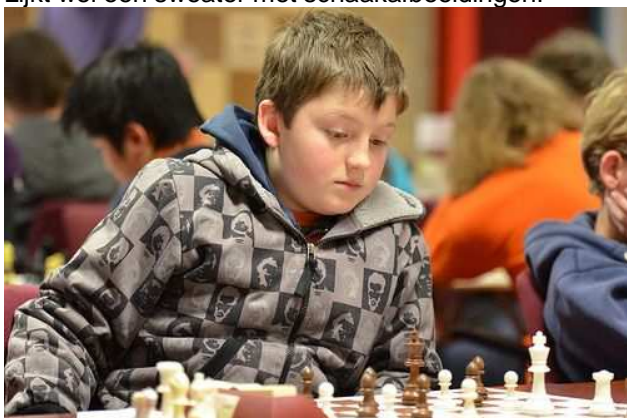
Lijkt wel een sweater met schaakafbeeldingen!