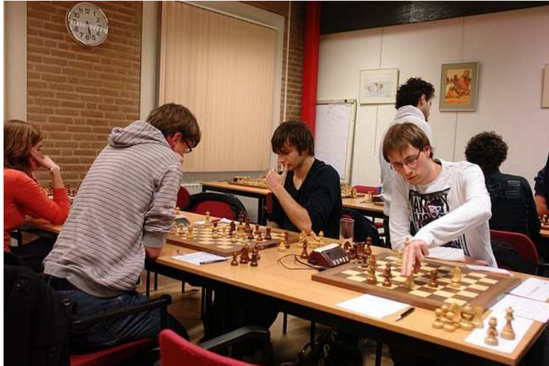
Schaakmaat Meesterklasse A 2010