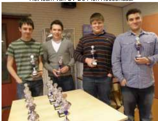
Het team van SV De Pion Roosendaal