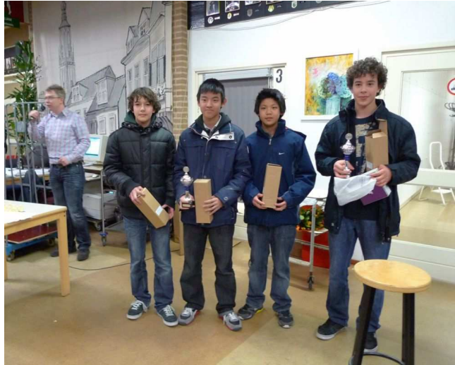
Kampioen Charlois Europort Meesterklasse A 2010