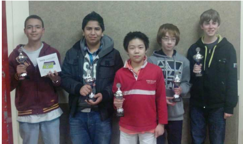
Kampioen Zukertort Meesterklasse C 2010