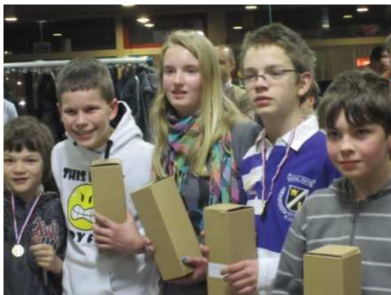
Kampioen Unitas D-categorie 2010