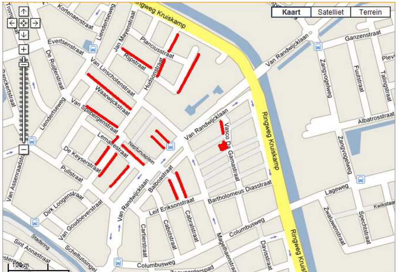
figuur: de parkeerplekken zijn aangegeven met een paar donkere strepen

Parkeergelegenheid is op de parkeerplaats van aangrenzende winkelcentrum en omliggende straten. Daarnaast is het mogelijk in de Flint garage te parkeren. Deze is te vinden door de borden Flint te volgen en ligt aan de Walikerstraat 14. De routebeschrijving is gelijk aan die van de speellocatie tot de bestuurder borden tegenkomt voor de Flint garage. Vanuit de speellocatie is dit 10 minuten lopen.